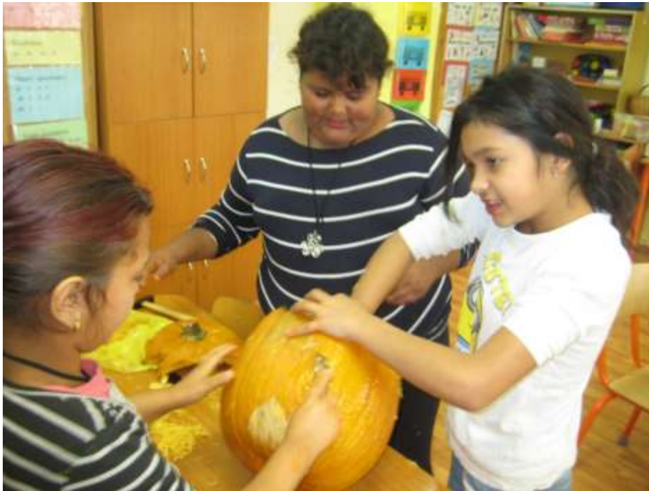
REV - Tekvičkovo