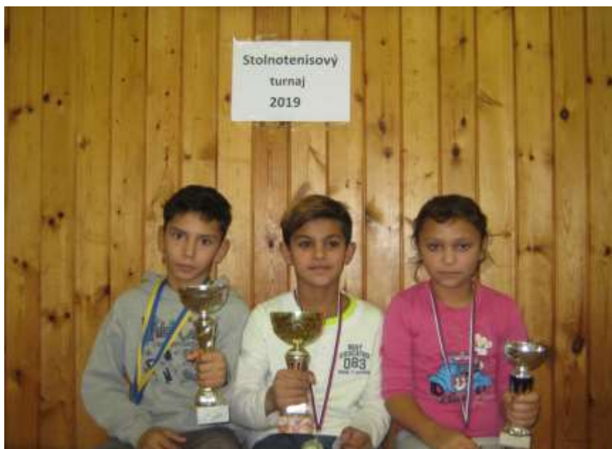
Vianočný stolnotenisový turnaj 2019