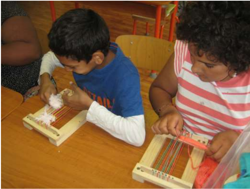
Voľnočasové aktivity – tkanie na krosienkach