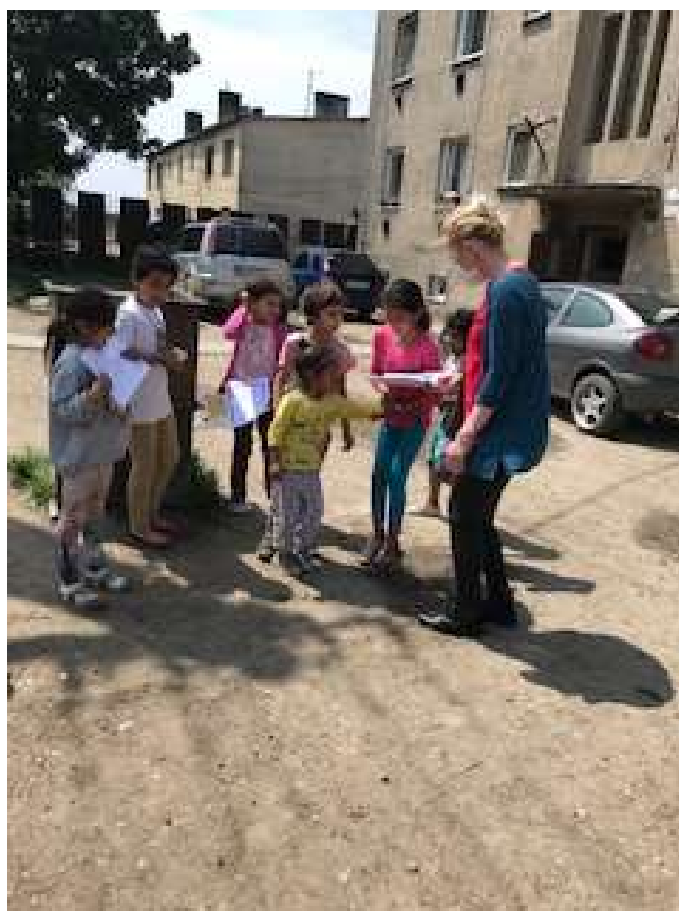
Návšteva v komunite v rámci dištančného vzdelávania