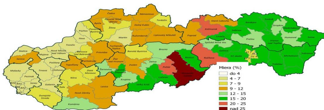
Miera evidovanej nezamestnanosti v okresoch k 31.12..2015

Nezamestnanosť v jednotlivých okresoch SR: